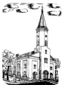
Kościół p.w. Św. Marii Magdaleny