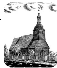
Kościół p.w. Św. Walentego

konto bankowe św. M. Magdaleny: 19 1050 1171 1000 0022 0499 6538