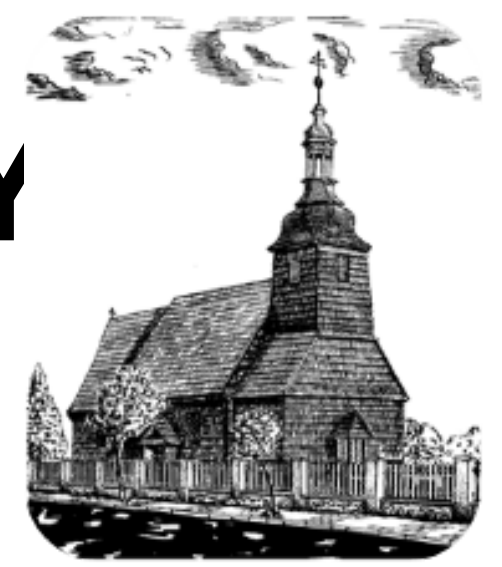
Kościół p.w. Św. Walentego

Gazetka Parafialna do użytku wewnętrznego