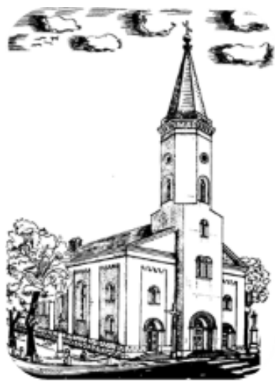
Kościół p.w. Św. Marii Magdaleny